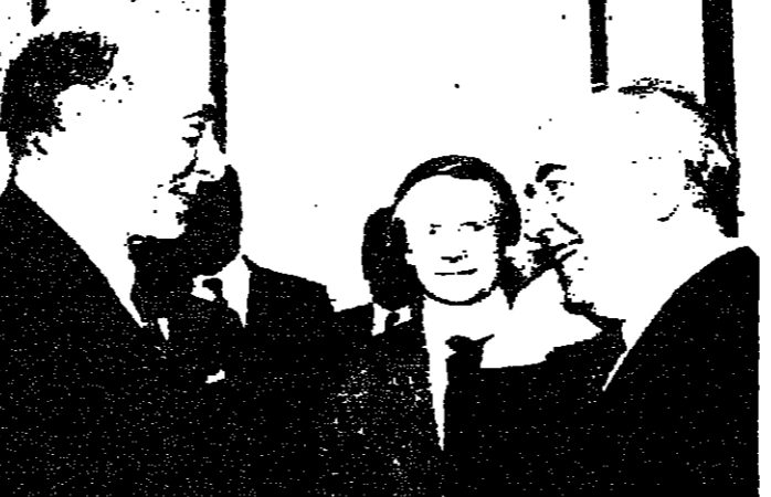
غورباتشوف يرحب بالامين العام لحلف شمال الاطلسي

بحث الوحدة الامنية مع شيفاردنارزه وغورباتشوف في بحث الوحدة الامنية مع شيفاردنارزه وغورباتشوف